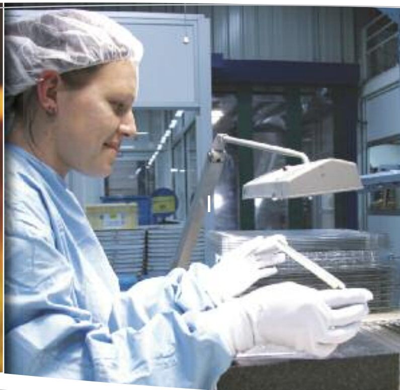
Contrôle des pièces avant réutilisation

« C'est une belle harmonie quand le faire et le dire vont ensemble. » Montaigne