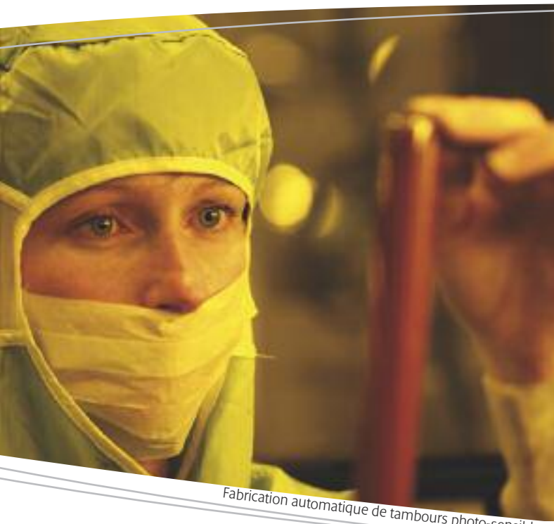
Fabrication automatique de tambours photo-sensibles