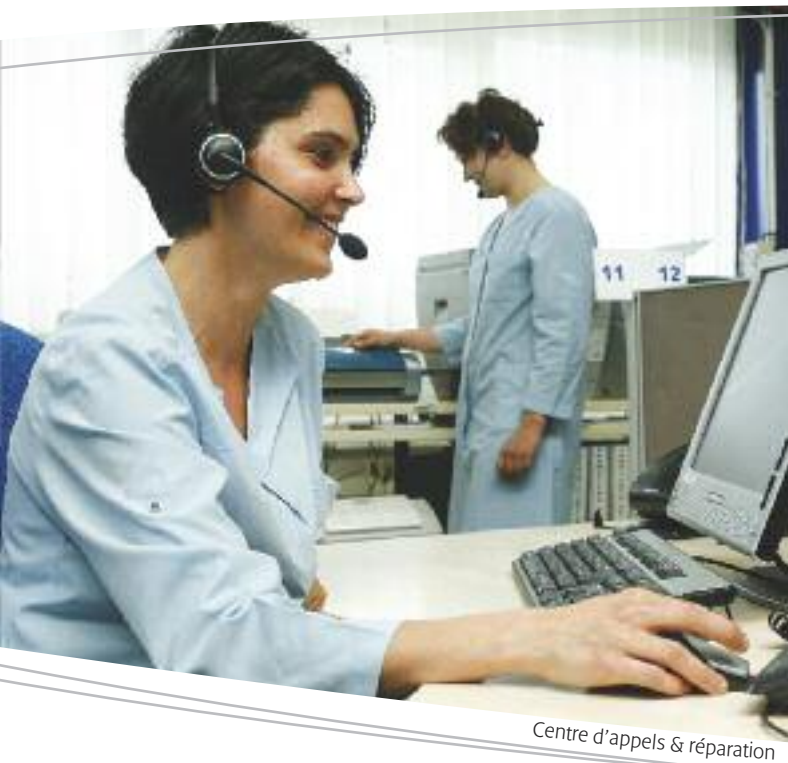
Centre d'appels & réparation