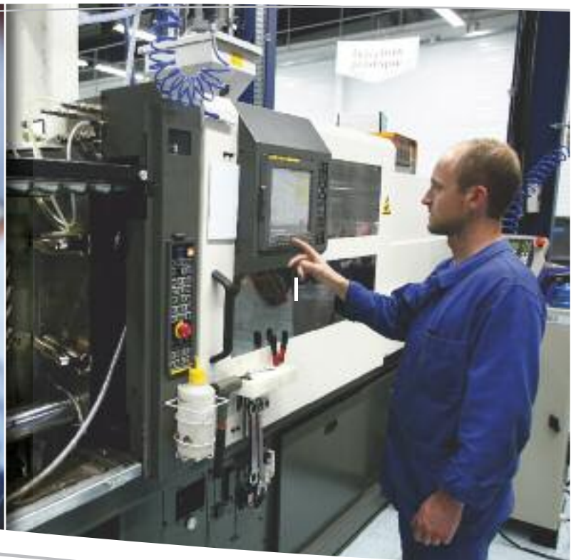
Injection plastique & usinage