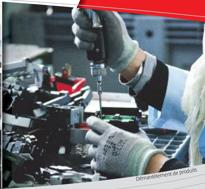
Démantèlement de produits