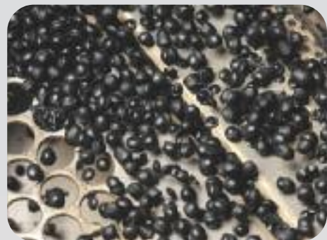
Granulés plastiques régénérés