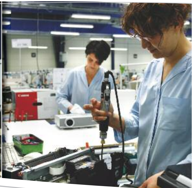
Atelier Agréé Régional Canon