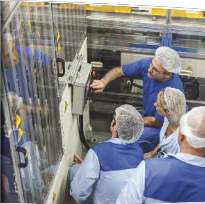
Atelier remplissage de bouteilles toner