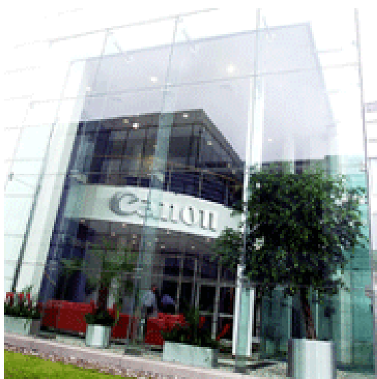
CANON EUROPE STOCKLEY PARK, LONDON

Ce projet déborde largement du seul cadre de la formation sur lequel voudrait le réduire la direction française. Il touche au comportemental, à la personnalité de chacun d'entre nous, à ce que nous sommes ; à ce titre, il est potentiellement porteur de dérives qu'on souhaite être à même d'appréhender. La direction française se refusant à présenter tous les aspects de ce dossier, celui-ci a été reporté.